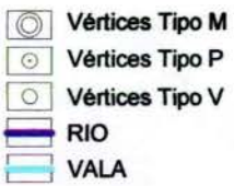
Planta de Situação: