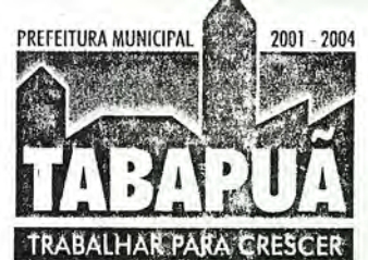
TABELA ANEXA - TABAPUÃ